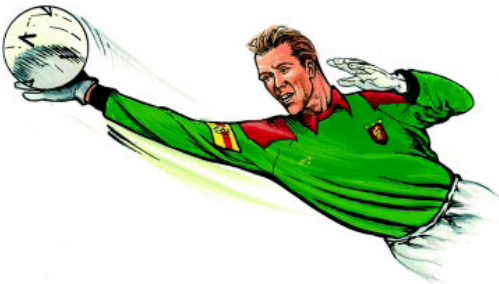
Guardameta - Portereo