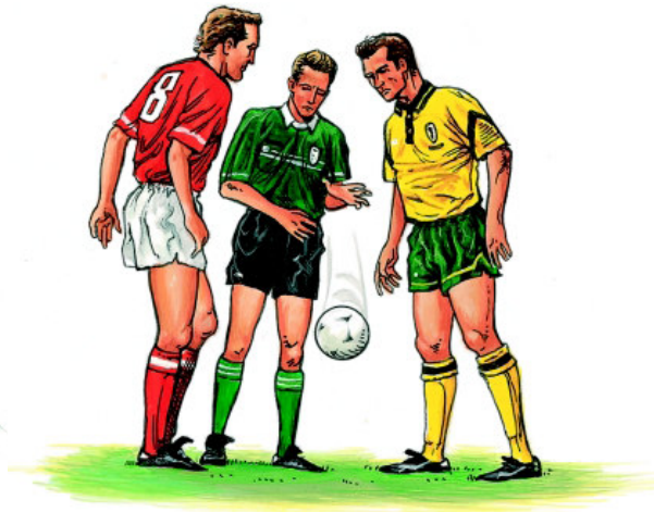
Árbitro y dos jugadores